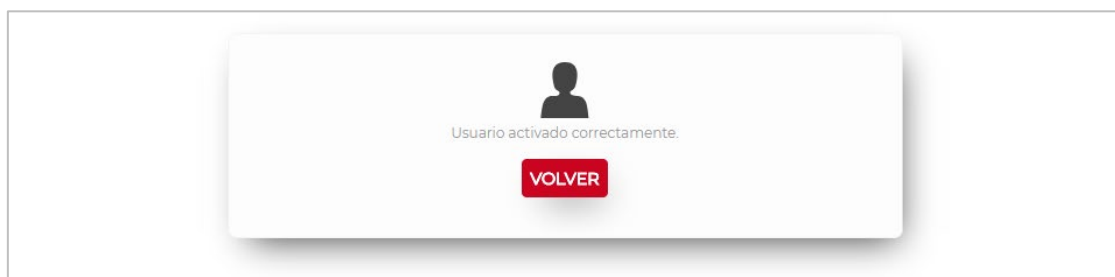
Figura 5. Usuario activado correctamente.

Una vez validadas correctamente, la aplicación procede a asignarle la contraseña introducida y a activar la cuenta. Una vez realizado todo el proceso se informa por pantalla de la correcta activación de la cuenta o de algún posible error producido.