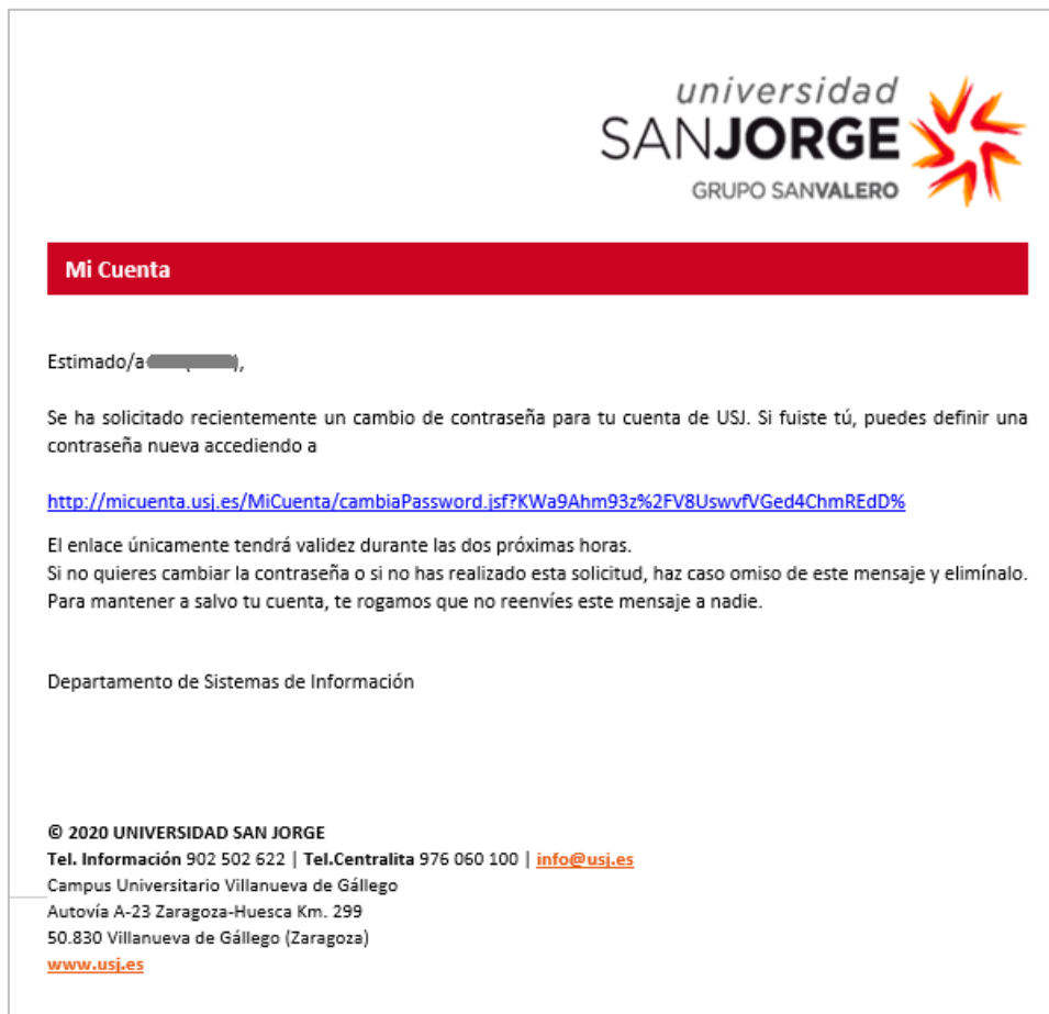
Figura 9. Correo que recibe el usuario para realizar la recuperación.

Las contraseñas deberán seguir estas pautas: