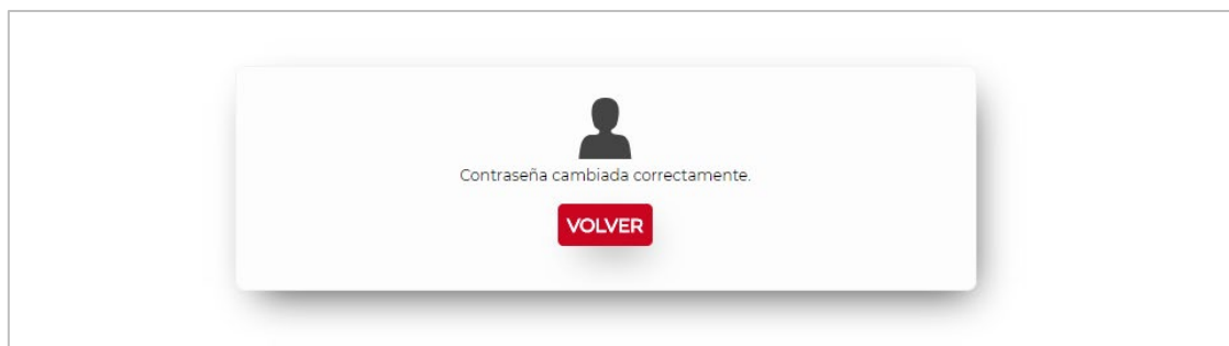
Figura 11. Contraseña restablecida correctamente.

Una vez validadas correctamente, la aplicación procede a asignarle la contraseña introducida y se informa por pantalla del correcto cambio de la contraseña o de algún posible error producido.