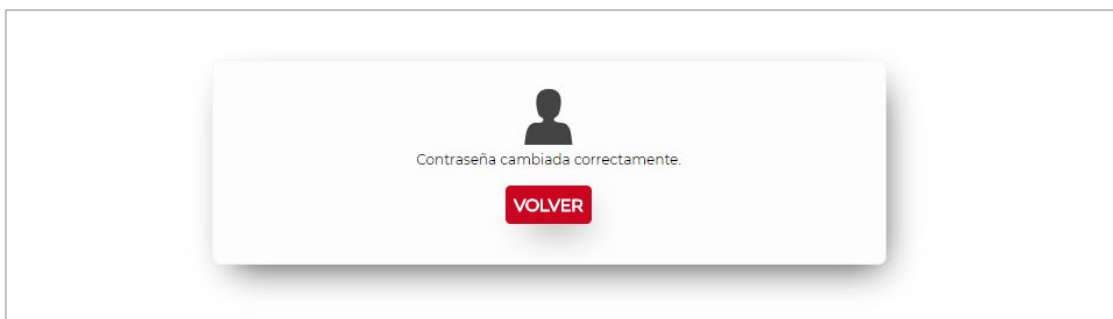
Figura 7. Contraseña cambiada correctamente.

Una vez validadas correctamente, la aplicación procede a asignarle la contraseña introducida y se informa por pantalla del correcto cambio de contraseña o de algún posible error producido.